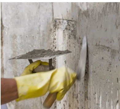
การฉาบซ่อมแซมผิวคอนกรีต ด้วยมอร์ตาร์กันซึมชนิดคริสตัลไลน์ PENECRETE MORTAR™

สามารถใช้ซ่อมแซมโครงสร้างเดิม เพื่อเป็นการเตรียมพื้นผิว ก่อนการใช้งานผลิตภัณฑ์ซีเมนต์กันซึมชนิดคริสตัลไลน์ PENETRON® เพื่อประสิทธิภาพสูงสุดในการป้องกันการซึมผ่านของน้ำ